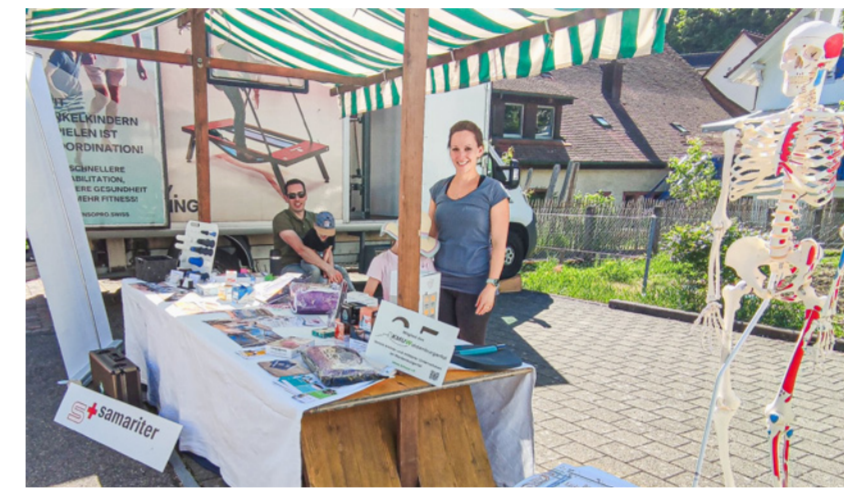
Wie man fit bleibt, erfährt man beim «Chraftchäller».