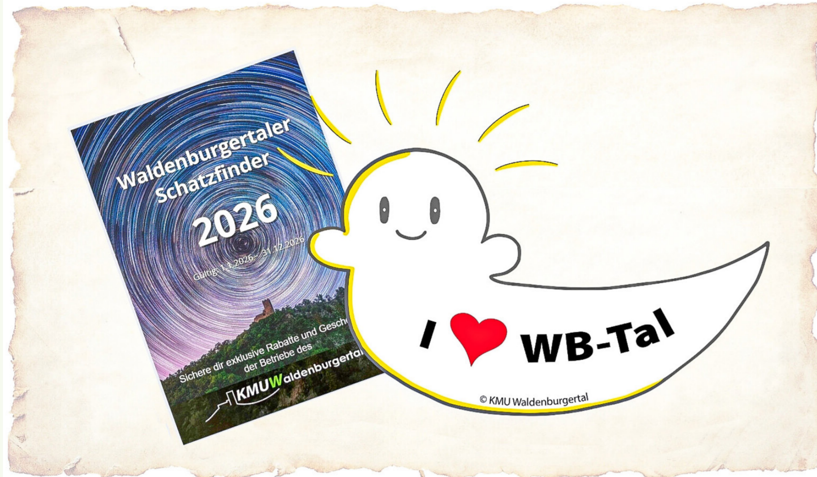
Die Schätze des Waldenburger Tals: «Vo du. Für di.»

Wo man gerne lebt und arbeitet Waldenburger Tal | Im Tal trifft Zusammenhalt auf Unternehmergeist